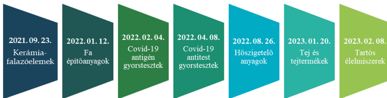
1. ábra: Gyorsított ágazati vizsgálatok

A jogalkalmazás gyorsításának általános igénye időközben visszaköszön egy tervezett német verseny-törvény-módosításban is, mely szerint egy ágazati vizsgálatot 18 hónapon belül le kell folytatni. 4 A jelen tanulmány – a teljesség igénye nélkül – a gyorsított ágazati vizsgálat egyes eredményeit sorolja fel, bemutatva az új jogintézmény jelentőségét, előnyeit és a fogyasztókra gyakorolt kedvező hatását. Figyelemmel arra, hogy a gyorsított ágazati vizsgálat jogintézményét a szakma már több helyütt ismertette, 5 e tanulmányban csupán a legfontosabb újszerű, innovatív javaslatokat mutatjuk be, és a vizsgálati jelentések tartalmán túlmutató összefüggésekre is rámutatunk. Az élelmiszeripari ágazati vizsgálatok a kézirat lezárásakor még folyamatban vannak, ezért azokról nem szólunk. A GVH a jelen tanulmány kéziratának lezárásáig 7 gyorsított ágazati vizsgálatot indított, 20-at meghaladó vállalkozás székhelyén tartott előzetes értesítés nélkül kutatást és közel 400 adatkérőt küldött ki.